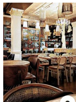
Olive Tree - Coventry

https://maps.app.goo.gl/ANcjsWJTxxL6o9kB7